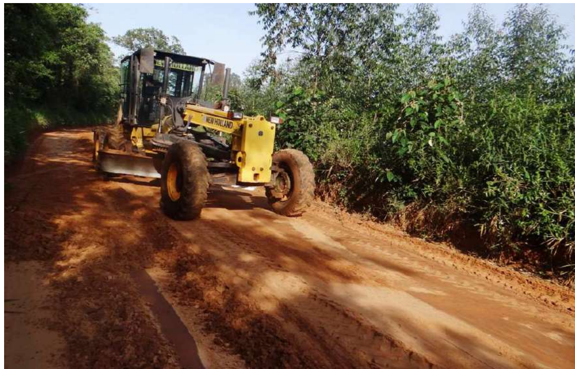
Patrol recuperando a estrada da Jacutinga

Os mesmos técnicos fizeram também vistoria na Rua Wilson Sabino de Godoy, no bairro Avaré 1, onde há problemas semelhantes.