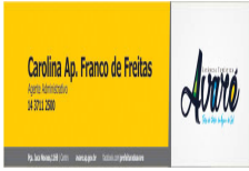
Carolina.jpg 33 KB