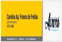
Carolina.jpg 33 KB