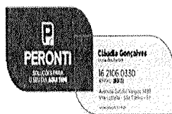
image001.png 26 KB