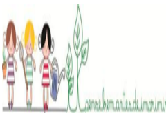
ass-evite.png 27 KB