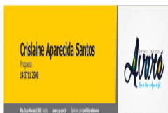
Assinatura.jpg 32 KB