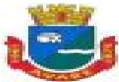
brasão_email.jpg 1 KB