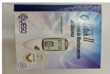
IMG_20231024_120734659_MFNR.jpg 2 MB