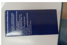
IMG_20231024_120828307_MFNR.jpg 3 MB