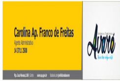
Carolina.jpg 33 KB