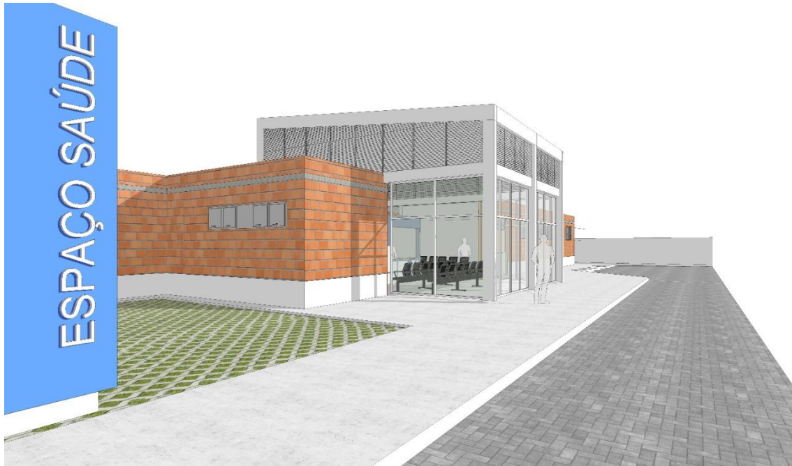
figura02 – Perspectiva