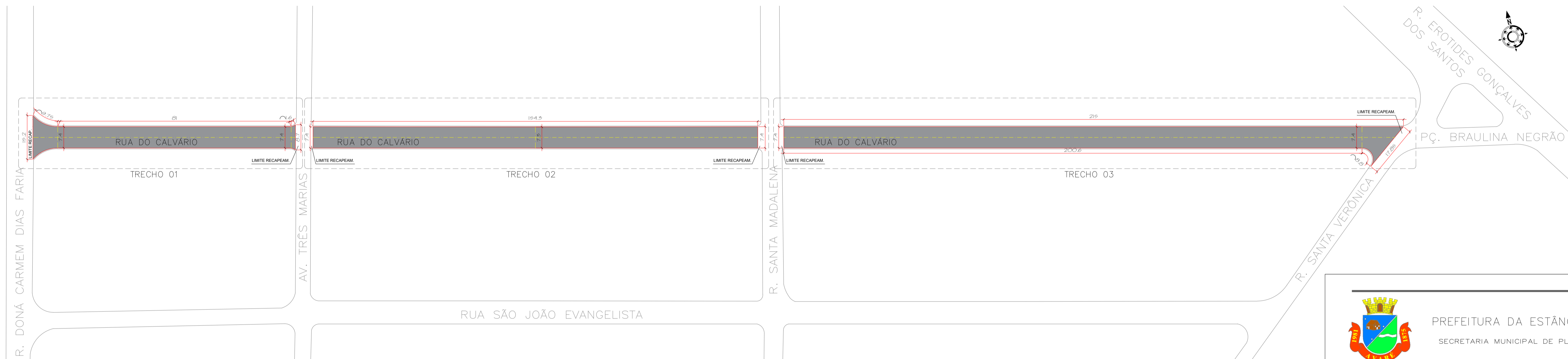
PLANTA BAIXA – ÁREA DE RECAPEAM. ASFÁLTICO ESCALA 1:750